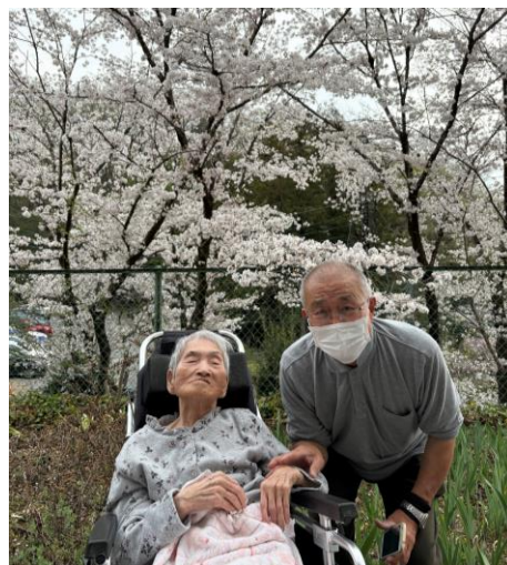
面会時にご家族と一緒に 桜を見ることができました