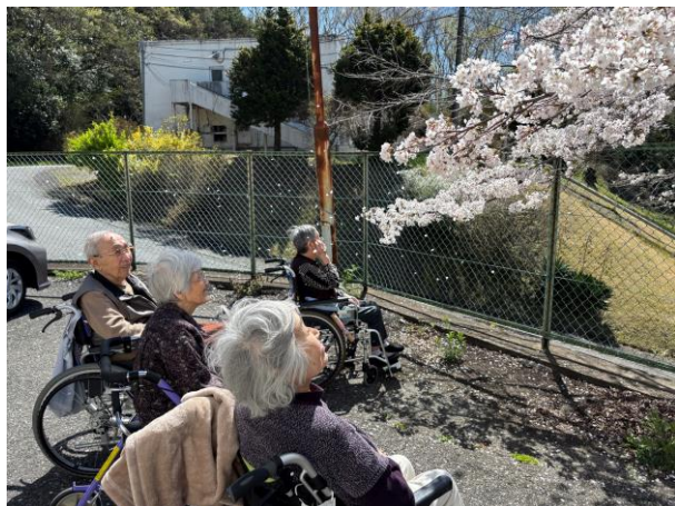
ちょうど桜吹雪が見られました！